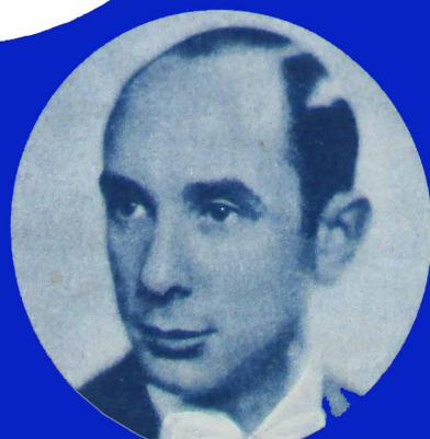
S. KATA SZEK